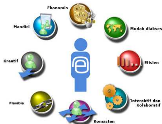
Gambar 1. Siklus Benefit of e-Learning

Beberapa keuntungan dari proses e-learning adalah ekonomis, mudah diakses, efisien, interaktif dan kolaboratif, konsisten, fleksibel, kreatif dan mandiri.