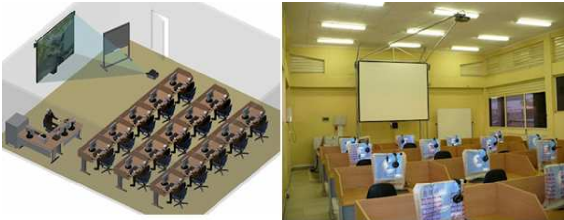
Gambar 3. Model Multimedia Classroom

Berikut gambaran dari keadaan suatu sistem kelas yang menerapkan Multimedia Classroom sistem: