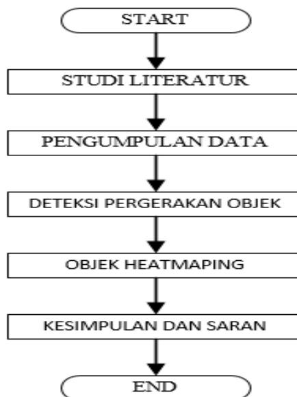
Gambar 1. Tahapan Penelitian.

Penelitian dan pengembangan yang dilakukan adalah untuk menghasilkan produk algoritma analisa pola berkeliling pembeli di dalam sebuah toko dan mendapatkan heatmap (pemetaan) dari setiap area. Penelitian ini akan dibagi menjadi beberapa tahapan, setiap tahapan akan membantu menentukan hasil yang sesuai dengan tujuan penelitian. Tahapan yang digunakan digambarkan dengan flowchart sesuai dengan gambar berikut: