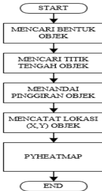
Gambar 3. Tahapan Pemetaan Riwayat Objek.

Operasi morfologi yang telah dilakukan akan menyisahkan citra yang bergerak yang telah terpisah dari background , sebelum bisa masuk ke tahap selanjutnya objek harus dideteksi bentuknya untuk mendapatkan ukuran dari objek dan jumlah objek yang terdeteksi dalam citra. Fungsi yang digunakan dalam operasi ini adalah cv2.findContours() . Kontur adalah garis khayal yang menghubungkan titik-titik yang mempunyai ketinggian yang sama. Kontur ini dapat memberikan informasi relief, baik secara relatif, maupun secara absolut.