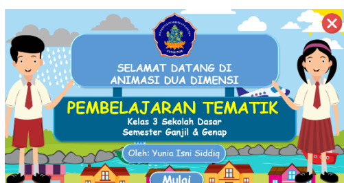
Gambar 3. Tampilan awal