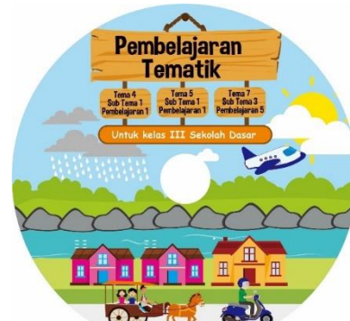
Gambar 2. Label CD ( Compact Disk )