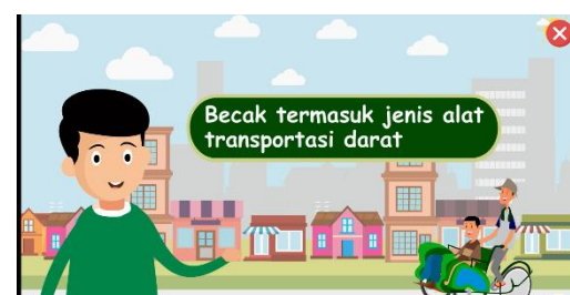
Gambar 4. Tampilan Isi Materi