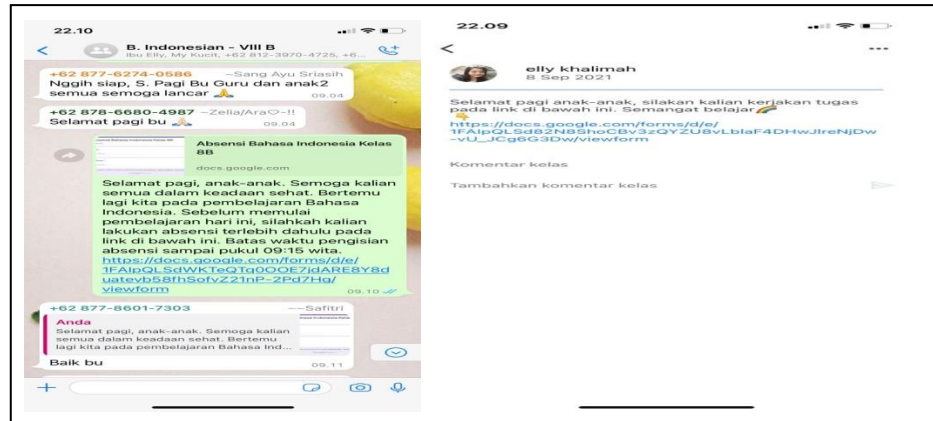
Gambar 2. Tampilan Whatsapp Group

Penerapan Google Form , langkah awal yaitu memberitahu siswa bahwa link salah satu baik tes kuis dan ulangan sudah dikirim pada Google Classroom melalui Whatsapp Group , terkadang untuk mengefisienkan waktu ibu juga memberikan siswa link melalui Whatsapp Group secara langsung. Pemberian link baik di Google Classroom maupun di Whatsapp Group , nantinya siswa hanya mengklik link yang sudah tertera sehingga siswa dapat melihat dan mengerjakan tugas, kuis dan ulangan yang guru berikan. Tampilan Whatsapp Group disajikan pada Gambar 2 .