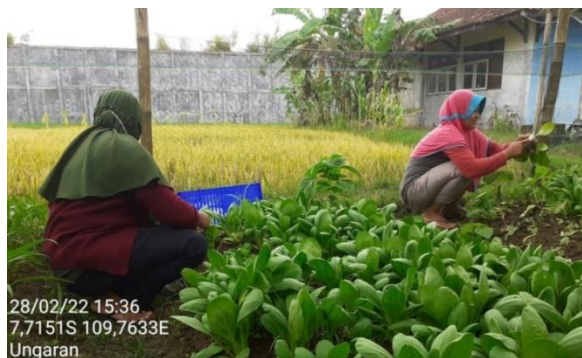
Gambar 6. Panen Sayur Program Pangan Lesatai (P2L) Kampung KB