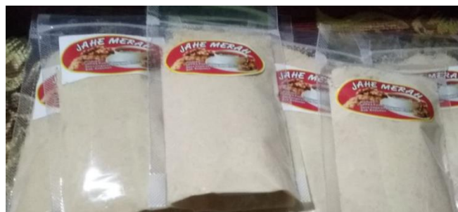
Gambar 4. Produk Jahe Merah Kampung KB