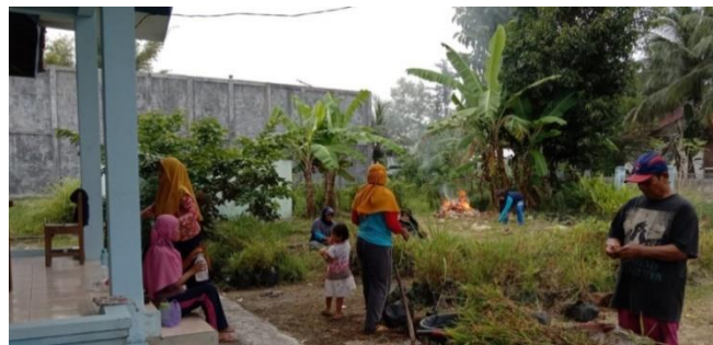
Gambar 3. Panen Jahe Merah oleh Warga

merah kepada masyarakat dengan harapan nantinya bisa di tanam di rumah masing-masing dan jika sudah saatnya panen hasilnya akan di beli oleh Pokja Kampung KB untuk kemudian di olah menjadi jahe merah instan. Berdasarkan data di atas dapat diketahui bahwa dalam meningkatkan kesejahteraan masyarakat, Kampung KB memiliki berbagai macam upaya baik secara langsung maupun tidak langsung. Upaya meningkatkan kesejahteraan secara langsung bisa dilihat dari adanya produk unggulan dalam Kampung KB (jahe merah instan) dimana masyarakat bisa terlibat dan merasakan dampaknya dengan cara ikut menanam jahe merah dan hasilnya bisa dijual kepada Pokja Kampung KB. Sedangkan upaya meningkatkan secara tidak langsung bisa dilakukan dengan cara melakukan pendataan kepada masyarakat khususnya masyarakat yang kurang mampu, seperti masyarakat yang memiliki RTLH (Rumah Tidak Layak Huni). Setelah didapatkan data tersebut, pihak Pokja Kampung KB memberikan usulan langsung kepada pemerintah agar nantinya jika ada bantuan, masyarakat tersebut bisa diprioritaskan. Hasil wawancara diatas diperkuat oleh hasil observasi dan dokumentasi lapangan terkait pelaksanaan program Kampung KB.