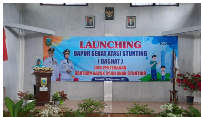
Gambar 5. Launching Program Atasi Stunting