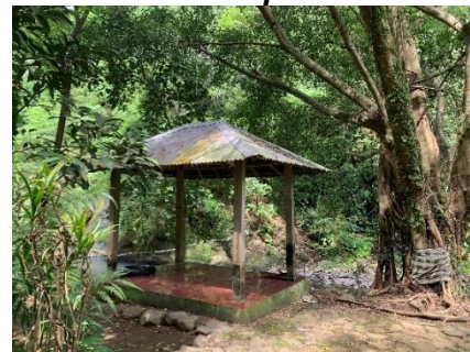
Gambar 4. Tempat beristirahat berupa saka pat

Terkait dengan ketersediaan fasilitas toilet umum dan layanan jasa informasi, dalam wawancara yang penulis lakukan bahwa ketersediaan fasilitas berupa layanan jasa tiket dan informasi sudah ada namun secara fisik tempatnya belum ada. Sementara layanan tiket dan informasi