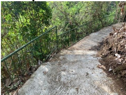
Gambar 3. Akses jalan menuju Air Terjun Tembok Barak

Dalam hal akses internet jangkauannya sangat sulit di wisata Air Terjun Tembok Barak, karena keberadaan lokasi di tengah hutan (pedalaman) sehingga susah untuk mendapatkan akses sinyal dan jaringan. Untuk memudahkan para wisatawan mencari atau mencapai lokasi air terjun, sudah ada juga petunjuk petunjuk arah berupa pelang kecil namun tidak terlihat ada petunjuk terkait informasi keselamatan pengunjung. Sementara itu, mengenai penyediaan layanan jasa transportasi berupa penyewaan sepeda motor, jika ada wisatawan yang memerlukan, masalah ini langsung ditangani oleh pengelola dengan mengomunikasikannya dengan pihak warga yang bergerak di bidang layanan tersebut.