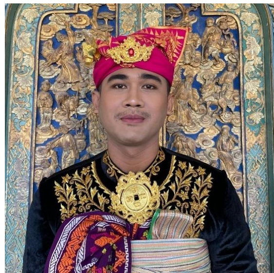
Gambar 10. Aksesoris Pengantin Pria