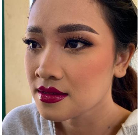
Gambar 3. Tata Rias Wajah Pengantin Wanita

Berikut merupakan langkah-langkah merias wajah pengantin pria: