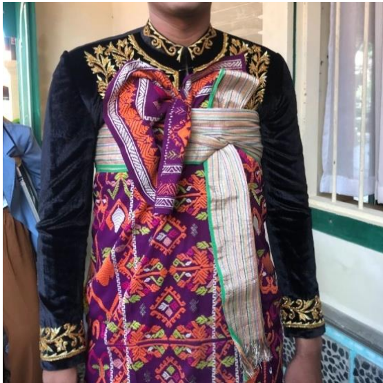
Gambar 8. Busana Pengantin Pria

Pada aksesoris pengantin meliputi: Subeng cererot , bros, cincin dan gelang pada pengantin wanita yang tidak memiliki makna khusus dan berfungsi untuk menambah keindahan serta keestikaan. Sedangkan pada pengantin pria hanya menggunakan bros dan memiliki fungsi yang sama yaitu untuk menambah keindahan. Tidak terdapat pakem pada aksesoris pengantin wanita Bali Madya Kabupaten Karangasem. Berikut merupakan langkah-langkah pemasangan busana pengantin wanita: