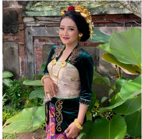
Gambar 9. Aksesoris Pengantin Wanita

Berikut merupakan langkah-langkah pemasangan busana pengantin pria: