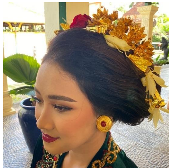
Gambar 5. Tata Rias Rambut Pengantin Wanita

Pada tata rias rambut pengantin pria menggunakan udeng kain prada dan dibentuk dengan bentuk "kepek dara" ke arah kiri yang merupakan bentuk khas yang sering dipakai oleh keluarga kerajaan Puri Agung Karangasem dan memiliki makna sebagai simbol seorang pemimpin dalam melindungi rakyat. Udeng berfungsi