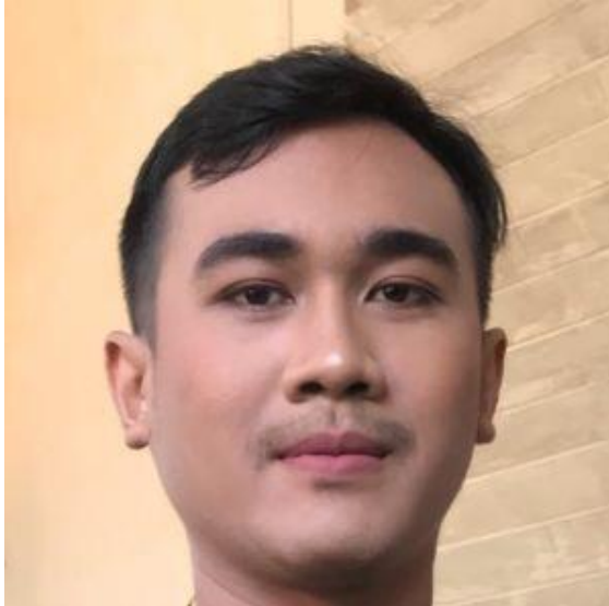
Gambar 4. Tata Rias Wajah Pengantin Pria

Pada tata rias rambut meliputi: Pusung leklek yang merupakan pakem pada tata rias rambut pengantin wanita, pusung leklek adalah pusungan khas Kabupaten Karangasem yang dibentuk menggunakan rambut asli dari pengantin wanita. Namun pada zaman dahulu apabila rambut pengantin dinilai kurang tebal maka akan menggunakan potongan daun mangkok untuk menambah kesan volume pada rambut. Pusung leklek diarahkan ke kiri sebagai simbol keluwesan dan kelembutan dari seorang wanita. Pusung leklek berfungsi untuk membuat rambut dari pengantin wanita terlihat lebih rapi dan anggun.