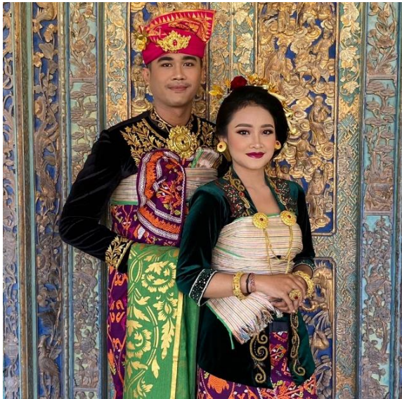
Gambar 11. Tata Rias Pengantin Bali Madya Karangasem