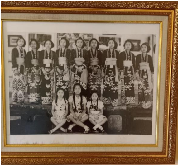
Gambar 2. Keluarga Puri Agung Karangasem

Seiring dengan berjalannya waktu, tata rias ini mulai digunakan untuk upacara pernikahan yang berlangsung di Puri Agung Karangasem. Tata rias ini digunakan oleh pengantin pria dari Puri Agung Karangasem yang akan menikahi pengantin wanita yang bukan berasal dari keluarga Puri Agung Karangasem. Aksesoris pada tata rias rambut pengantin wanita juga ditambahkan seperti menggunakan bunga tunjung emas dan bunga semanggi emas. Pada saat ini, selain digunakan untuk pernikahan, tata rias pengantin ini juga masih tetap digunakan untuk menyambut tamu kehormatan Puri Agung Karangasem.