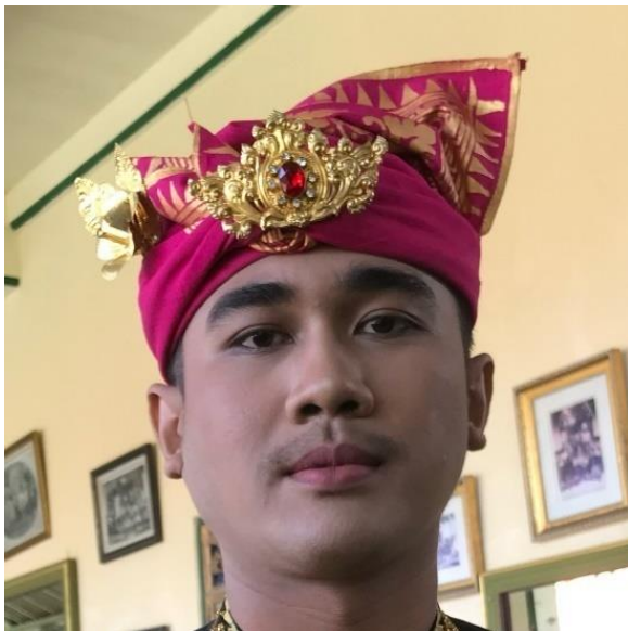
Gambar 6. Tata Rias Rambut Pengantin Pria