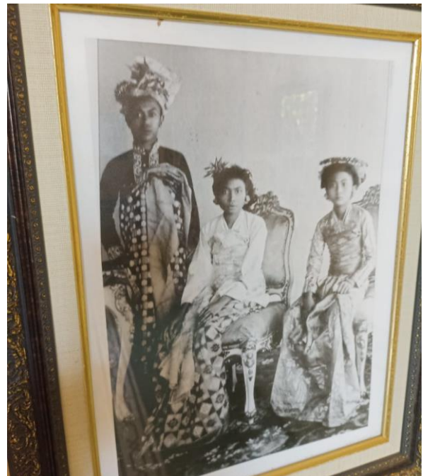
Gambar 1. Tata Rias Pengantin Bali Madya Jaman Dahulu

Berdasarkan hasil penelitian yang diperoleh, Tata Rias Pengantin Bali Madya Kabupaten Karangasem atau Payas Madya Karangasem merupakan tata rias pengantin pada tingkatan kedua yang digunakan pada upacara pernikahan. Tata rias ini awalnya digunakan untuk menyambut tamu kehormatan yang berkunjung ke Puri Agung Karangasem, pada saat itu tata rias ini terkesan sederhana dan hanya menggunakan bunga seperti bunga mawar merah, bunga cempaka putih, dan bunga cempaka emas pada pengantin wanita.