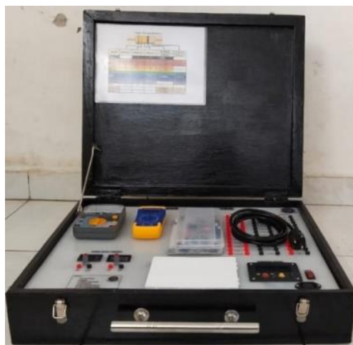
Gambar 2. Hasil Produk Akhir Media Pembelajaran Rangkaian Listrik RLC

Dari hasil data ahli isi, ahli media, uji kelompok kecil dan uji kelompok besar yang diperoleh, dapat dianalisa beberapa kelemahan dan kekurangan yang ada pada media pembelajaran rangkaian listrik RLC, dari analisis tersebut dilakukan suatu perbaikan mulai dari perbaikan pada buku panduan agar lebih mudah dan menarik, kemudian penambahan komponen dan fungsi komponen yang lebih jelas, kemudian perbaikan cara penggunaan alat ukur dan cara mengukur, kemudian menambahkan cara merangkain rangkaian seri dan paralel agar media pembelajaran rangkaian listrik RLC mudah digunakan, kemudian perbaikan pada video penggunaan media pembelajaran rangkaian listrik RLC agar lebih mudah digunakan oleh peserta didik saat praktikum. Pada gambar 2 merupakan tampilan produk akhir media pembelajaran rangkaian listrik RLC.