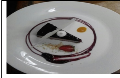
Blueberry Cheese Cake