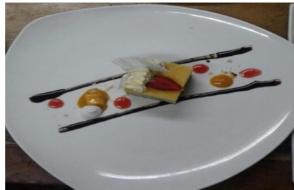
Passion Basil Cake

Pertama saat pembuatan passion basil cake , dalam pemilihan bahan baku yang digunakan tidak konsisten maka setiap menghasilkan produk pastry mengalami perbedaan yang bisa dilihat dari teksturnya, cita rasa dan lain sebagainya. Adapun permasalahan saat pembuatan produk pastry dan cara menanganinya yaitu :