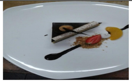
Balinese Opera Cake