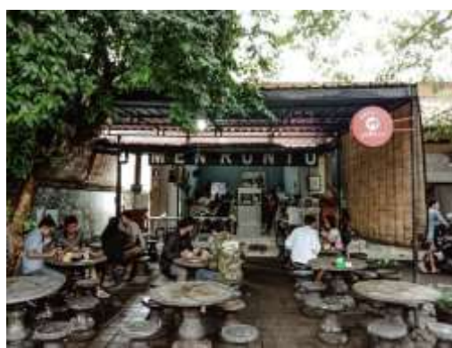
Gambar 1.7 Suasana Warung Men Runtu di siang hari.

Selain Rujak Kuah Pindang, Warung Men Runtu juga menyediakan beragam jenis rujak lainnya, seperti rujak kacang, rujak uyah sere 22 , dan rujak gula merah. Adanya beragam pilihan varian rujak ini karena setiap pelanggan memiliki selera yang berbeda, dan Warung Men Runtu ingin menjadi warung rujak yang menyediakan menu paling lengkap di antara warung rujak lainnya. Selain rujak, menu yang juga digemari pelanggan di Warung Men Runtu adalah tipat pleceng dan tipat cantok. Banyak warung yang menjual tipat pleceng dan tipat cantok di Bali, tapi Warung Men Runtu memiliki resep yang khas dan berbeda dari warung lainnya. Untuk rasa pedas, pelanggan juga bisa meminta berapa banyak cabai yang dicampur dalam makanan, tanpa adanya tambahan biaya. Penjual membebaskan para pelanggan untuk menggunakan cabai, selama persediaan masih ada dan harga cabai masih terjangkau.