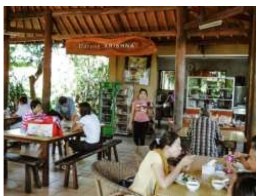
Gambar 1.6 Suasana makan siang di Warung Krishna

Ketika masuk ke warung ini, anda tidak akan menemukan daftar menu. Hal tersebut dikarenakan menu yang disajikan hanya satu yaitu ayam betutu kuah khas Bali, yang dapat disajikan dengan nasi, bubur, dan ketupat atau orang Bali biasa menyebutnya tipat 11 . Ayam betutu yang dijual di Warung Krishna tentunya berbeda dengan ayam betutu di tempat lain. Perbedaan terletak pada racikan bumbu yang digunakan serta proses memasaknya. Warung Krishna memiliki takaran bumbu betutu tersendiri. Bahkan saking khasnya, Warung Krishna juga menjual bumbu betutu siap pakai yang dapat digunakan untuk memasak ayam betutu oleh para pelanggannya.