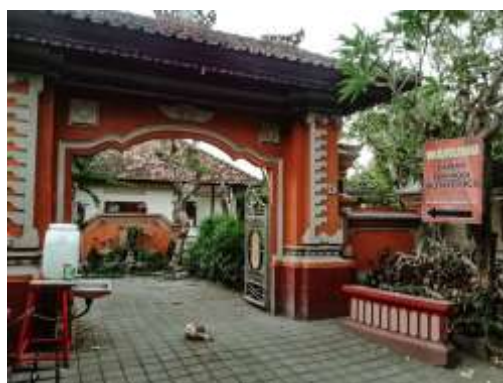
Gambar 1.2 Pintu masuk ke Warung Lawar Pak Kodi