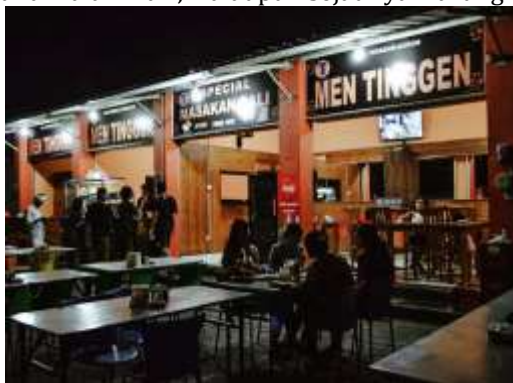
Gambar 1.3 Suasana Warung Men Tinggen ketika malam hari.

Warung nasi ini berlokasi di Jalan Pejang Sari, tepatnya di Pasar Intaran, Sanur Kauh. Ini menjadi salah satu destinasi kuliner yang wajib dicoba oleh wisatawan asing, wisatawan domestik, ataupun masyarakat lokal. Warung makan ini memiliki tempat yang sederhana, namun selalu ramai pembeli. Warung Nasi Men Tinggen menyajikan menu makanan tradisional Bali dengan rasa yang otentik dan dikenal luas dimasyarakat sebagai salah satu destinasi kuliner malam. Hal tersebut dikarenakan jumlah pengunjung sangat ramai ketika malam hari, walaupun sejatinya warung nasi ini buka mulai sore hari.