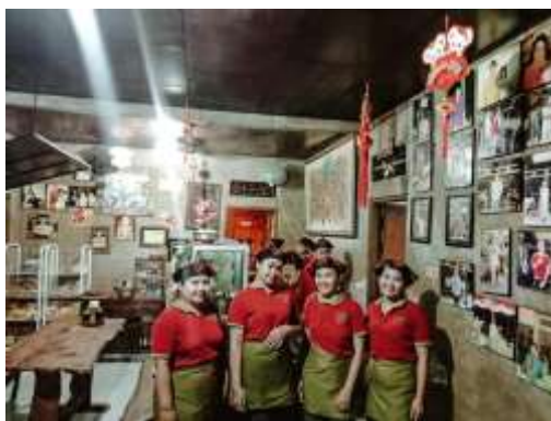
Gambar 1.1 Para pramusaji Warung Mak Beng berfoto di area bagian dalam warung.

Untuk harga menu di Warung Mak Beng, satu porsi hidangan dijual dengan harga Rp55.000, belum termasuk minuman. Minuman yang ditawarkan juga bervariasi mulai dari air mineral dan aneka minuman ringan. Setiap harinya tempat makan ini bisa menghabiskan puluhan kilogram ikan jangkai untuk memenuhi kebutuhan pelanggannya. Pelanggan yang datang diantaranya adalah wisatawan domestik seperti dari Jakarta, Bandung, Jawa, dan wisatawan lokal, wisatawan mancanegara seperti dari New Zealand, Australia, Jepang, dan Inggris, serta wisatawan lokal Bali.