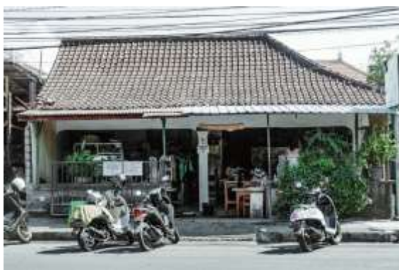
Gambar 1.5 Tampak depan Warung Adi yang berlokasi di Jalan Danau Buyan, Sanur.