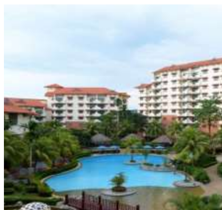
Gambar 2. Holiday Inn Resort Batam