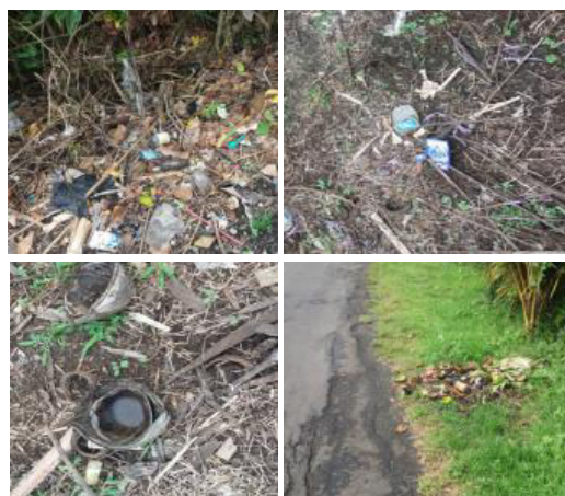
Gambar 6. Permasalahan Sampah di Desa Belatungan

Namun disisi lain, masih saja ada sebagian besar masyarakat Desa Belatungan yang tidak menjaga kebersihan lingkungan rumahnya dengan membuang sampah sembarangan, membuang sisa-sisa kaleng/botol bekas dan kulit kelapa sembarangan yang menimbulkan genangan air sehingga menjadi sarang nyamuk. Beberapa permasalahan tersebut dapat dilihat pada Gambar 6.