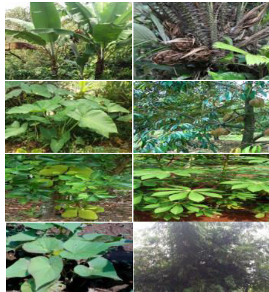
Gambar 3. Hasil Pertanian Sampingan di Desa Belatungan

Kendatipun hasil pertanian andalan seperti cengkeh, kopi, kelapa dan cacao secara umum mampu menopang perekonomian masyarakat Desa Belatungan, namun kesulitan juga dirasakan oleh masyarakat jika hasil pertanian tersebut tidak dapat diperoleh dalam waktu singkat dan harus menunggu tahunan untuk bisa panen. Apalagi jika terjadi kondisi iklim buruk yang menyebabkan gagal panen, tentu masyarakat mengalami kesulitan dalam perekonomiannya yang hanya dengan mengandalkan hasil pertanian tersebut. Oleh karena itu, sebenarnya ada beberapa hasil pertanian lainnya (sampingan) yang mudah diperoleh di desa Belatungan dan sebenarnya bisa dikembangkan dan dimanfaatkan sebagai sumber penghasilan, antara lain: pisang, salak, talas, durian, nangka, singkong, ubi jalar, bambu, dan lainnya, seperti yang dapat dilihat pada Gambar 3.