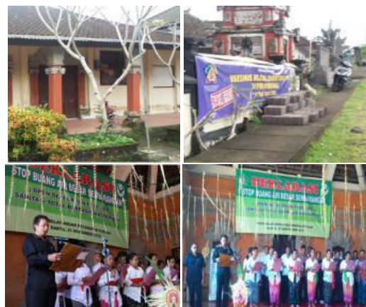
Gambar 5. Ketersediaan Posyandu dan Deklarasi ODF di Desa Belatungan

Potensi yang dimiliki Desa Belatungan ditinjau dari segi fasilitas dan layanan kesehatan yaitu terdapat satu posyandu yang memberikan pelayanan kesehatan pada masyarakat desa. Kesadaran masyarakat terhadap kesehatan juga sudah mulai ada peningkatan dengan salah satu bukti kegiatan masyarakat desa yang telah menggelar Deklarasi Open Defecation Free (ODF) atau gerakan stop buang air besar sembarangan [3], yang dapat dilihat pada Gambar 5.