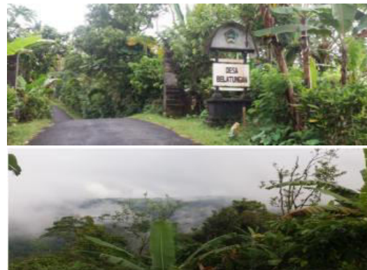
Gambar 1. Kondisi Umum Desa Belatungan

Gawang dengan jumlah KK sebanyak 6, Yeh Sibuh dengan jumlah KK sebanyak 6, dan Antap Gawang dengan jumlah KK sebanyak 26 [1-2]. Kondisi umum desa Belatungan tampak pada Gambar 1.