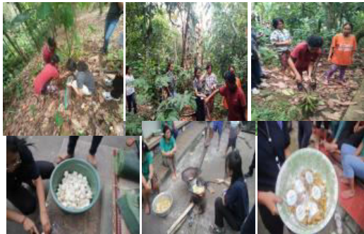
Gambar 8. Luaran Program Ekonomi Kerakyatan

Belatungan ” sebagai lahan usaha masyarakat. Alasan pemberdayaan pisang dan talas ini sebagai lahan usaha masyarakat adalah karena bahan-bahan ini yang mudah dicari dan mudah diberdayakan di desa Belatungan untuk dapat dimanfaatkan sebagai sumber penghasilan masyarakat. Adapun contoh produk luaran ekonomi kerakyatan yang nantinya dikembangkan berupa kripik dan jajan, yang selengkapnya dapat dilihat pada Gambar 8.