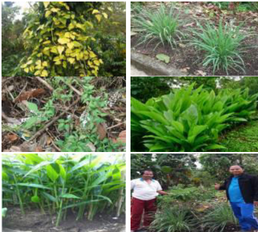
Gambar 7. Potensi Tanaman Obat di Desa Belatungan

Selain potensi fasilitas kesehatan yang berupa posyandu yang ada di desa Belatungan ini, potensi sumber daya alam seperti: daun sirih, serai, kumis kucing, kunyit, jahe, dan tanaman lainnya dapat digunakan untuk obat-obatan tradisional. Adapun potensi sumber daya alam tersebut selengkapnya dapat dilihat pada Gambar 7.