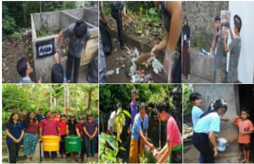
Gambar 12. Luaran Program Sanitasi dan Kesehatan Desa