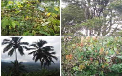
Gambar 2. Hasil Pertanian Unggulan Desa Belatungan

menitikberatkan pada sektor pertanian, dengan komoditi hasil pertanian andalan yaitu: kopi, cengkeh, kelapa dan kakao. Beberapa komoditi tersebut ditunjukkan pada Gambar 2.