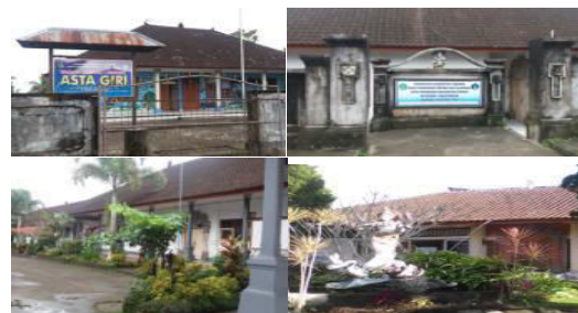
Gambar 4. Sekolah TK, SD, dan SMP di Desa Belatungan

Potensi yang dimiliki Desa Belatungan ditinjau dari bidang pendidikan yaitu sudah terdapat sekolah formal pada pendidikan dasar dan menengah antara lain: TK Asta Giri, SD Negeri 1 dan 2 Belatungan, dan SMP Negeri 3 Pupuan. Adapun potensi bidang pendidikan tersebut selengkapnya dapat dilihat pada Gambar 4.