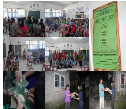
Gambar 9. Pembentukan Organisasi Kelompok, Pelatihan Manajemen dan Akuntansi, Penyusunan AD/ART Organisasi, Peningkatan Produktivitas dan Pemasaran

Melalui terobosan tersebut, maka biaya dapat ditekan karena bahan baku dapat diperoleh melalui sumber daya alam yang tersedia di Desa Belatungan. Selain itu, peningkatan produktivitas dan pemasaran dapat ditingkatkan melalui manajemen produksi yang baik yang dibuktikan dengan terbentuknya organisasi kelompok dan pengelolaan AD/ART yang baik dengan bekal pengetahuan yang diperoleh dari beberapa pelatihan manajemen dan Akuntansi. Adapun wujud pelatihan manajemen dan akuntansi tersebut dapat ditunjukkan pada Gambar 9.