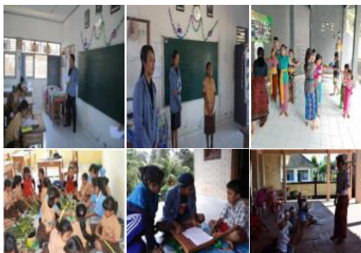
Gambar 10. Luaran Program Pendidikan, Seni, dan Budaya

keras, sehingga perlu kiranya untuk melaksanakan kegiatan tersebut. Alasan dilaksanakannya pembelajaran tari dan kidung adalah untuk mempertahankan kesenian Bali agar tidak luntur. Alasan pembelajaran pembuatan canang/banten, ketupat, dan klatkat adalah untuk mempertahankan keajegan budaya Bali. Adapun hasil/luaran dari terobosan yang dikembangkan dalam bidang pendidikan tersebut berupa pembelajaran calistung, pembelajaran sopan santun, kidung, tari, majejaitan bagi anak putri, dan membuat klatkat bagi anak pria. Luaran-luaran tersebut dapat dilihat selengkapnya pada gambar 10 berikut ini.