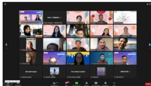
Gambar 1. Kegiatan pengabdian tahun 2022

Pada tahun 2022 lalu tim pengabdian masyarakat internasional kami telah mengadakan pengabdian masyarakat berupa pelatihan agar para mahasiswa Indonesia di Tiongkok memahami konsep merek/logo serta pelatihan strategi pengemasan produk/usaha dan pendampingan komunikasi bisnis di media digital. Dengan harapan usaha yang mereka rintis di Tiongkok dapat menggapai hasil yang lebih optimal, dalam melaksanakan pengabdian masyarakat tersebut kami bekerjasama dengan PCIM Tiongkok sebagai mitra pengabdian masyarakat Internasional. Pengabdian masyarakat internasional yang kami lakukan saat itu mendapat apresiasi besar dari para mahasiswa Indonesia di Tiongkok bahkan oleh warga Tiongkok sendiri, terbukti dengan jumlah peserta yang mencapai ratusan orang saat pengabdian tersebut kami lakukan. Adapun kriteria dari khalayak yang terlibat dalam pengabdian ini adalah mahasiswa yang sedang studi di Tiongkok.