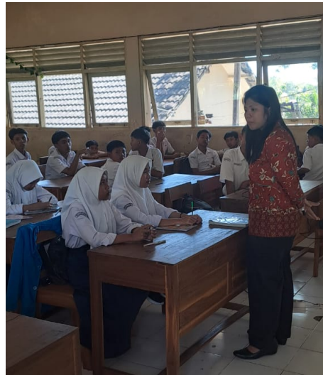
Gambar 2. Peneliti Menjadi Guru Yang Mengajar Di Kelas

Siswa diminta membangun gunung dan sesajen sesuai alat dan bahan yang telah dibawa siswa dari rumah. Guru dipertemuan sebelumnya meminta siswa membawa hasil pertanian yang mereka ketahui untuk menyusun gunung. Selama membuat proyek gunung dan sesajen seperti terlihat pada Gambar 3 dan 4, siswa diminta untuk mengidentifikasi tumbuhan dan mencari nama ilmiah dari tumbuhan yang digunakan di upacara Babad Dalam. Guru akan mengkonfirmasi hasil temuan siswa setelah proyek dipresentasikan dan kemudian menjelaskan makna filosofis dibalik pemakaian jenis tumbuhan tersebut di upacara Babad Dalam.