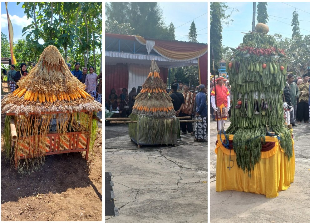
Gambar 1. Bentuk Gunungan di Upacara Babad Dalan Yang di Buat Oleh Masyarakat

Pembelajaran berbasis budaya Indonesia ini mengajak siswa untuk melihat kegiatan budaya Babad Dalan mulai dari membuat sarana dan prasarananya sampai ke tahap puncak upacara Babad Dalan dengan karnaval keliling desa. Pada kegiatan karnaval keliling desa setiap dusun diminta membuat gunung yang berisi hasil panen dari tiap dusun dibentuk menjadi berbagai macam bentuk misal rumah atau seperti gunung. gunung tersebut adalah lambang ucapan syukur atas berbagai hasil panen yang telah didapatkan masyarakat. gunung tersebut nantinya akan dibagikan kepada warga yang mengikuti upacara Babad Dalan untuk diperebutkan hasil panen yang menempel di gunung.