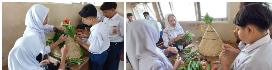
Gambar 3. Siswa Membuat Gunung Yang Digunakan di Upacara Babad Dalam

Siswa diminta membangun gunung dan sesajen sesuai alat dan bahan yang telah dibawa siswa dari rumah. Guru dipertemuan sebelumnya meminta siswa membawa hasil pertanian yang mereka ketahui untuk menyusun gunung. Selama membuat proyek gunung dan sesajen seperti terlihat pada Gambar 3 dan 4, siswa diminta untuk mengidentifikasi tumbuhan dan mencari nama ilmiah dari tumbuhan yang digunakan di upacara Babad Dalam. Guru akan mengkonfirmasi hasil temuan siswa setelah proyek dipresentasikan dan kemudian menjelaskan makna filosofis dibalik pemakaian jenis tumbuhan tersebut di upacara Babad Dalam.