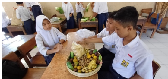
Gambar 4. Siswa Membuat Sesajen Buah Yang Digunakan di Upacara Babad Dalam

Siswa setelah menyelesaikan proyek, selanjutnya mempresentasikan proyek gunung dan sesajen yang telah mereka buat. Presentasi proyek dilakukan oleh semua kelompok dengan menjelaskan nama lokal tumbuhan, klasifikasi