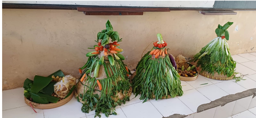
Gambar 5. Hasil Proyek Siswa Membuat Gunung dan Sesajen

ilmiah masing-masing tumbuhan, dan makna filosofis setiap tumbuhan yang digunakan untuk membuat gunung dan sesajen. Foto proyek gunung dan sesajen yang telah dibuat siswa untuk dilombakan dapat dilihat pada gambar dibawah ini.