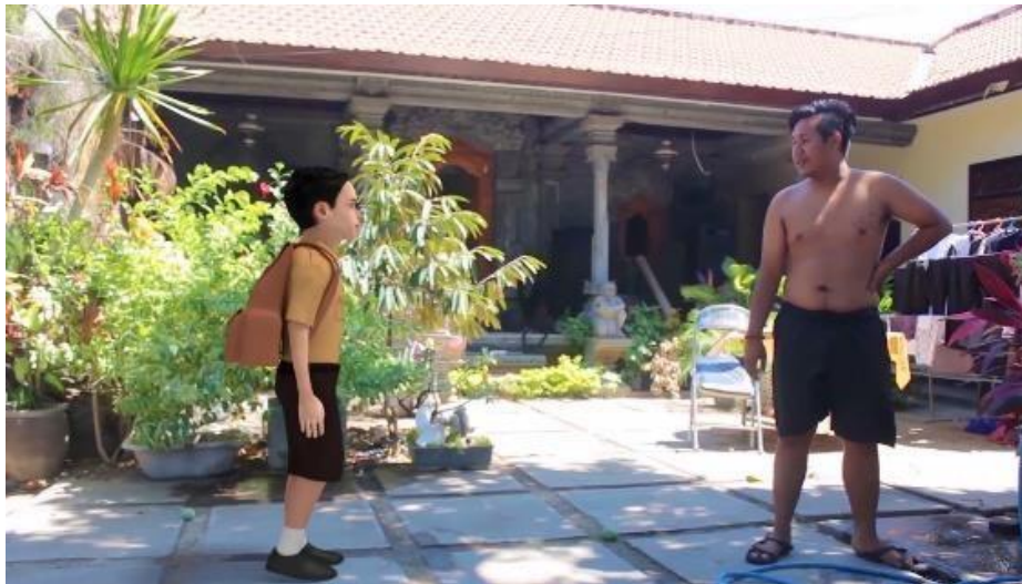
Gambar 6. Antar Muka Orang Tua dan Karakter 3D