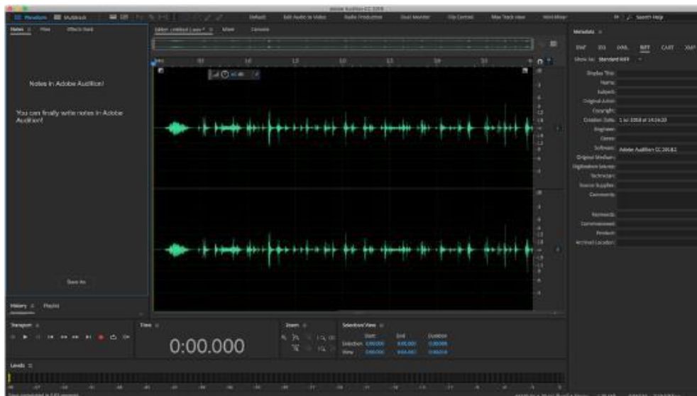
Gambar 4. Editing Efek Suara di Adobe Audition

Dalam proses perekam dialog dubber sudah sesuai dengan skenario pada storyboard dan langsung mengedit dengan menggunakan aplikasi Adobe Audition CC yang disesuaikan dengan gerakan mulut karakter 3D yang diperlukan pada video Pembelajaran .