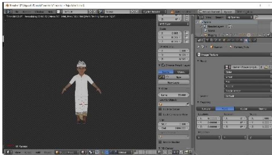
Gambar 2. Karakter 3D menggunakan Aplikasi Blender

pembelajaran Tri Rna ini menggunakan aplikasi Blender yang memiliki rancangan beberapa karakter animasi yang sudah di texture menggunakan aplikasi Adobe Photoshop dapat dilihat pada gambar dibawah ini: