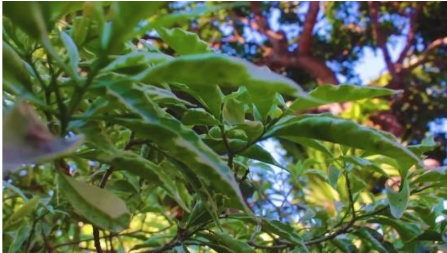
Gambar 5. Opening Video pembelajaran Tri Rna