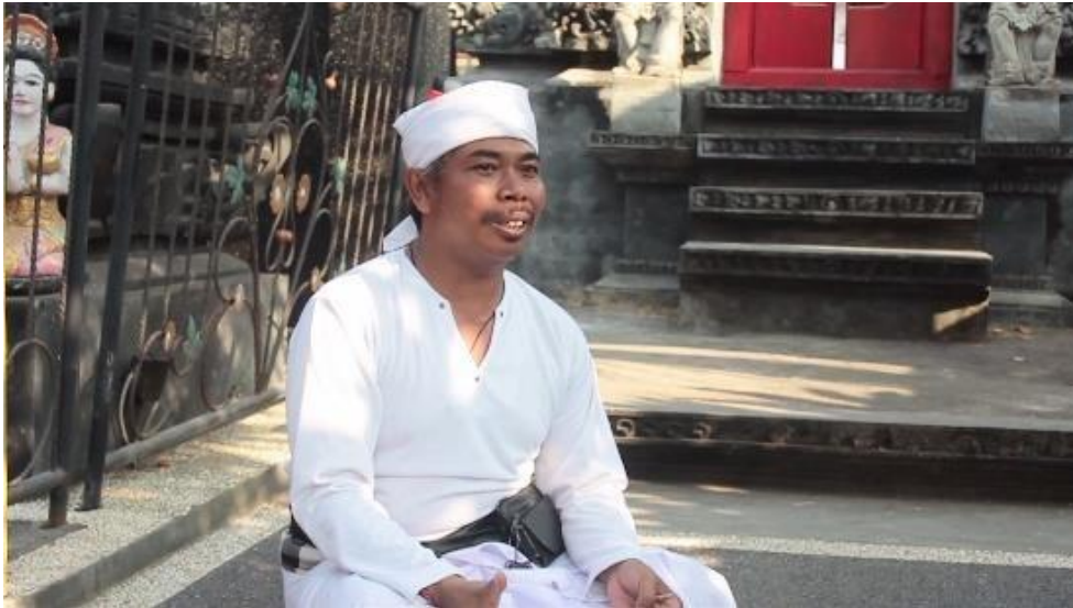
Gambar 7. Menjelaskan Materi Tri Rna