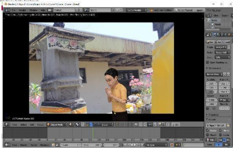
Gambar 3. Proses Pembuatan Animasi Aplikasi Blender