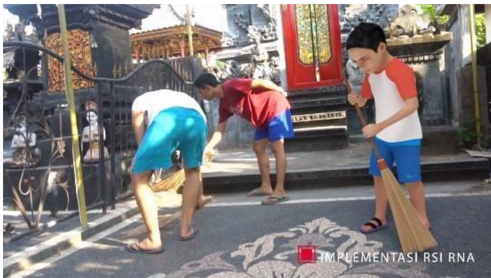
Gambar 8. Contoh Implementasi dari Rsi Rna